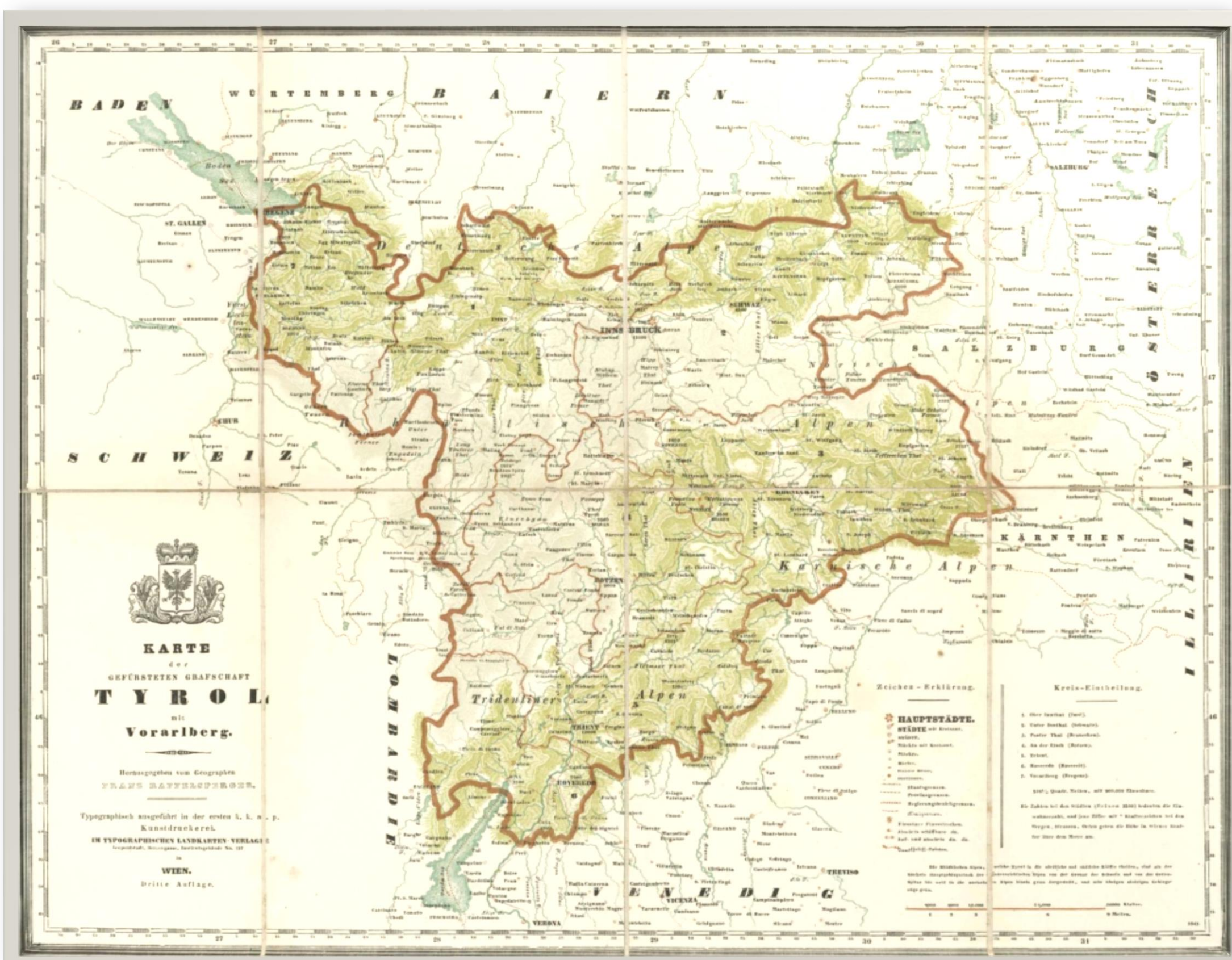
„Karte der Gefürsteten Grafschaft Tyrol mit Vorarlberg“, Franz Raffelsperger, Erster Typometrischer Atlas, Wien 1843, 3. Auflage.